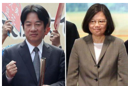
【中時電子報】總統施政不滿意度再攀升 綠營鐵票倉也挺不住 (詳見全文)