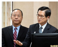
【自由時報】中國海軍傳對台軍「打招呼」 國防部長斥：統戰宣傳伎倆 (詳見全文)