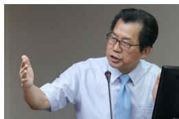
【聯合新聞網】環署長允諾修法後成立會報 立委批：即刻就該做 (詳見全文)