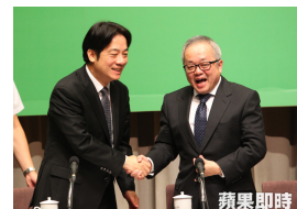
【蘋果日報】政院規劃：基本工資時薪漲至150元 最快明年1月上路 (詳見全文)